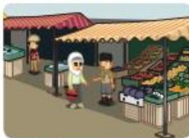
Gambar 10.14. Suasana jual beli di pasar.

Ashöbul Kahfi tidur di dalam gua mendapat perlindungan dan penjagaan dari Allah Swt. Sinar matahari tidak masuk ke dalam gua, sehingga tidak langsung mengenai tubuh mereka. Akibatnya, tubuh mereka tidak rusak. Dengan demikian, mereka pun tidak merasa kepanasan dengan sengatan sinar matahari.