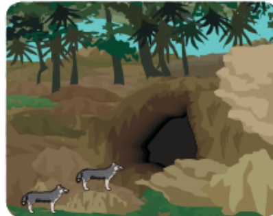
Gambar 10.12. Halaman depan gua.

Ashābul Kahfi merupakan kisah perjuangan tujuh orang pemuda yang menyelamatkan keyakinannya kepada Allah Yang Maha Esa. Mereka hidup di negeri Syam yang dikuasai bangsa Romawi. Saat itu, Syam diperintah oleh gubernur Romawi yang amat kejam, Daqianus namanya. Daqianus ialah seorang penyembah berhala yang amat fanatik. Ia menyebar mata-mata ke seluruh negeri Syam untuk mengetahui orang-orang yang tidak menyembah berhala. Jika orang suruhan Daqianus menemukan anggota masyarakat yang tidak menyembah berhala seperti yang dilakukan Daqianus, mereka akan dibawa ke hadapan Daqianus.