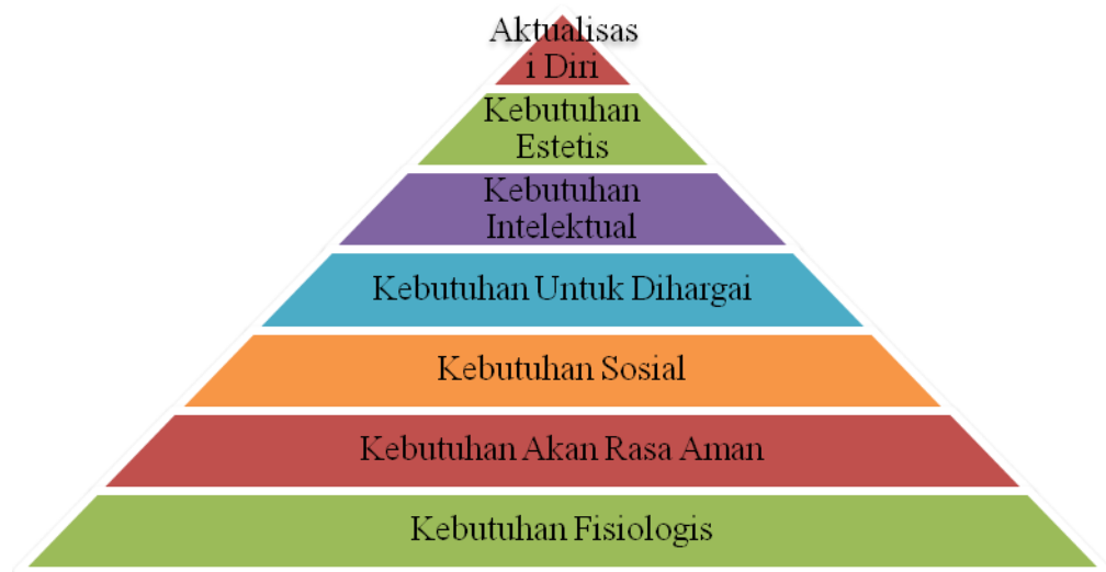
Gambar 1. Hirarki Kebutuhan Menurut Maslow