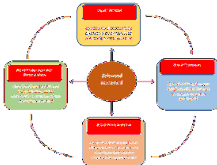
Gambar 1: Aspek Balance Score Card

Panagiotis et al., (2010) bahwa Kaplan dan Norton membagi BSC menjadi empat perspektif: keuangan, pelanggan, proses bisnis internal dan pembelajaran dan pertumbuhan. Balanced scorecard sebagai sistem manajemen ditunjukkan pada diagram berikut: (Gaspersz, 2011)